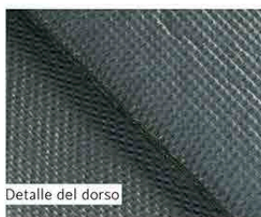
Detalle del dorso