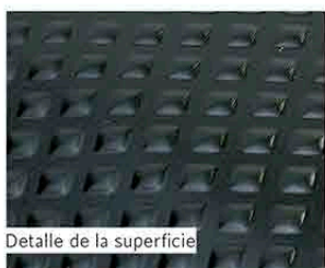
Detalle de la superficie